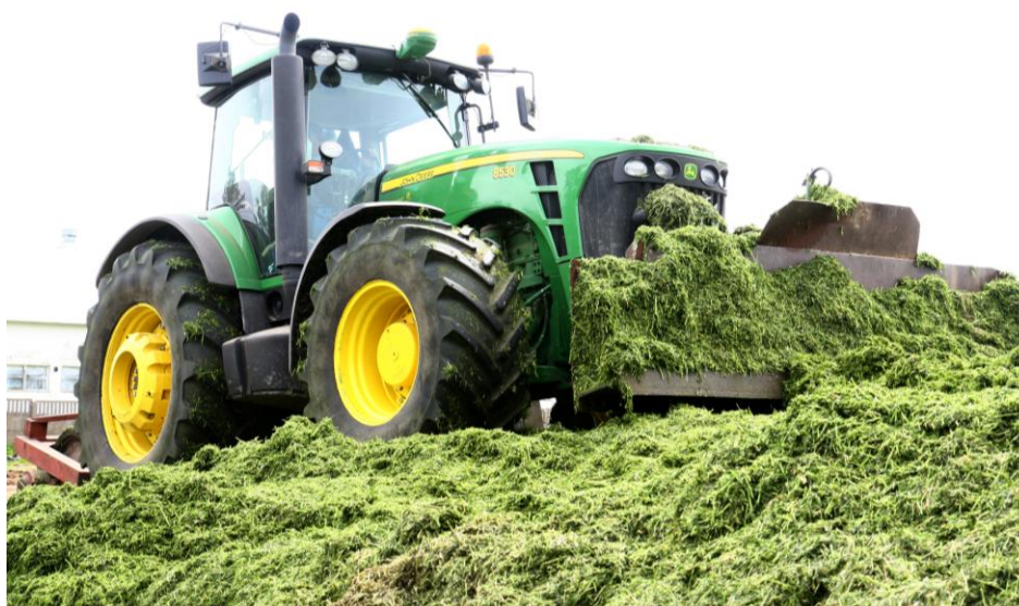
Bezpieczny ciągnik musi posiadać kabinę ochronną, zwłaszcza podczas prac na nierównym lub grząskim terenie

Jeśli chodzi o wypadki drogowe, to najgroźniejsze w skutkach były zderzenia pojazdów oraz potrącenia pieszych i rowerzystów . Wywrotki ciągników zdarzają się przede wszystkim podczas prac na grząskim, pofałdowanym terenie, przy wykonywaniu gwałtownych manewrów, czy przy ugniataniu przyzmy sianokiszonki. Manewrowanie ciągnikiem na trudnym terenie wymaga wiedzy i umiejętności doświadczonego kierowcy oraz zachowania szczególnej ostrożności. Bezpieczny ciągnik powinien posiadać kabinę, która w razie wywrotki chroni kierowcę przed przygnieceniem przez ciągnik. Jeśli dojdzie do wywrotki nie wolno wyskakiwać z kabiny ciągnika. Należy pozostać w środku i obydwoma rękami przytrzymać się tak, aby zapobiec wypadnięciu z ciągnika.