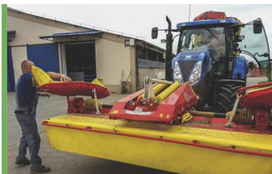
Przygotowanie do przejazdu transportowego.