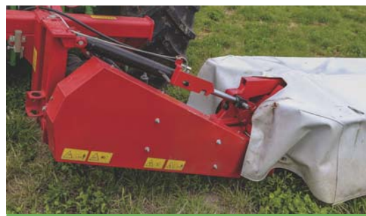
Ostona przekładni napędowej kosiarki.