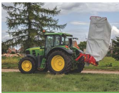
Przejazd z kosiarką w położeniu transportowym.