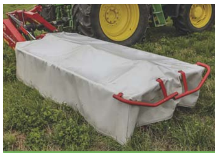
Fartuch ochronny kosiarki nie może być uszkodzony.