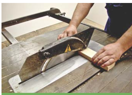
Ustawienie górnej osłony piły, dostosowane do wysokości ciętego materiału.