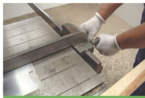
Ustawianie prowadnicy – w rękawiczkach ochronnych – brak ryzyka pochwycenia.