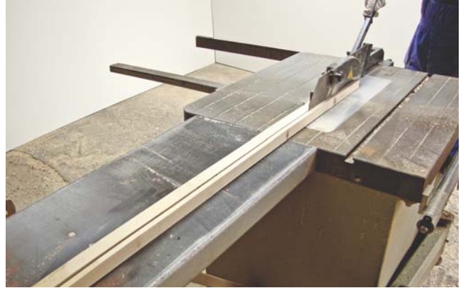
Wyposażenie stanowiska w stół przedłużony przy cięciu długich przedmiotów.