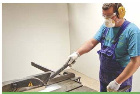
Stosowanie maski przeciwpyłowej przy pracach w zapyleniu i cięciu drewna twardego.